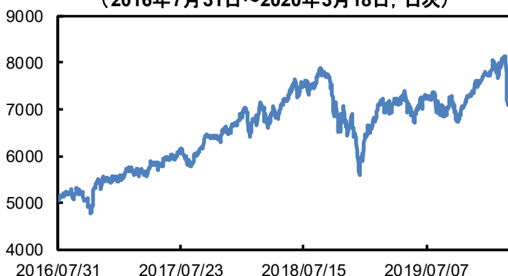
ラッセル2000グロス指数(配当込)の推移 (2016年7月31日~2020年3月18日, 日次)

新型コロナウイルス感染拡大を受け、FOMCは現地3日の緊急利下げに引き続き、15日にも緊急利下げを行い、FF金利の誘導目標のレンジを1.00%~1.25%から0.00%~0.25%に引き下げています。また、これに加えFRBによる資産購入の拡大や大量の流動性供給を行い、クレジット不安を解消すべく対応しました。RS社としては、このような金融政策も必要ですが、効果的な財政出動を打ち出し、収入が減ることを懸念している個人や企業の不安を取り除くことが重要と考えています。