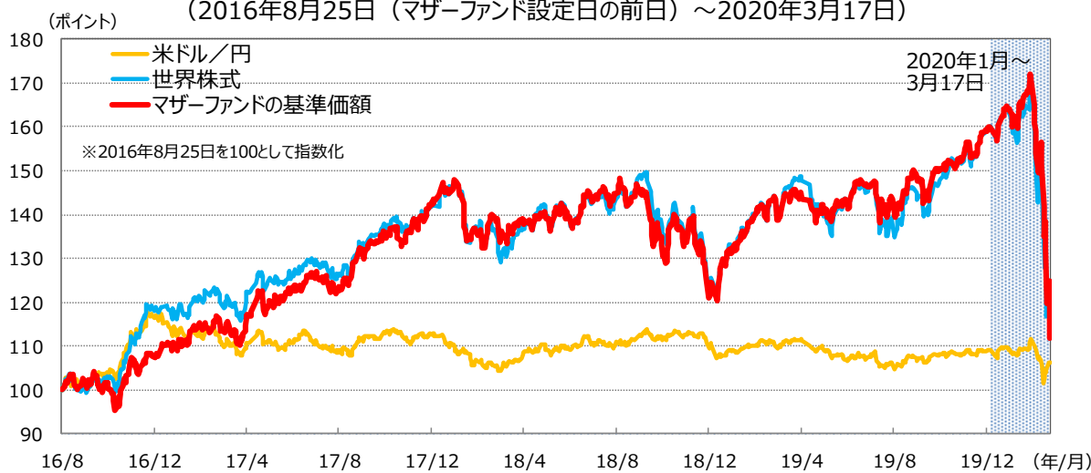
<マザーファンド、世界株式、米ドル/円の推移> (2016年8月25日 (マザーファンド設定日の前日) ~2020年3月17日)